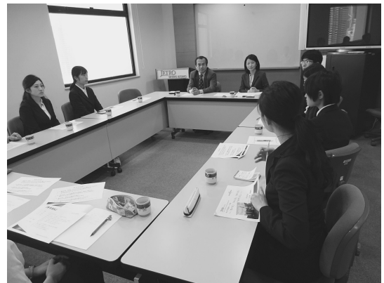
ジェットロ伊藤所長、宇都宮職員と意見交換

ASEAN 専門家としてフィリピン駐在2回の後、今回所長として香港に赴任となった。