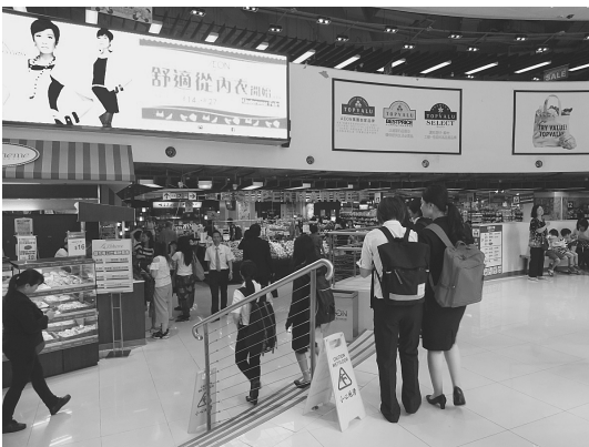
イオンの店舗視察