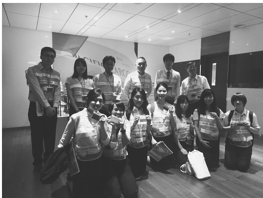
キャセイ航空貨物ターミナルにて西鉄国際物流の方々と