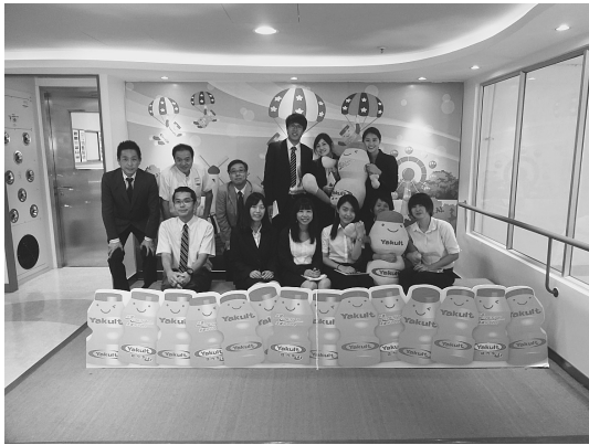
ヤクルト大埔工場にて

また、レストラン、幼稚園、学校などへの販売も強化しているとの説明があり、テレビCMにも力を入れているとのことであった。