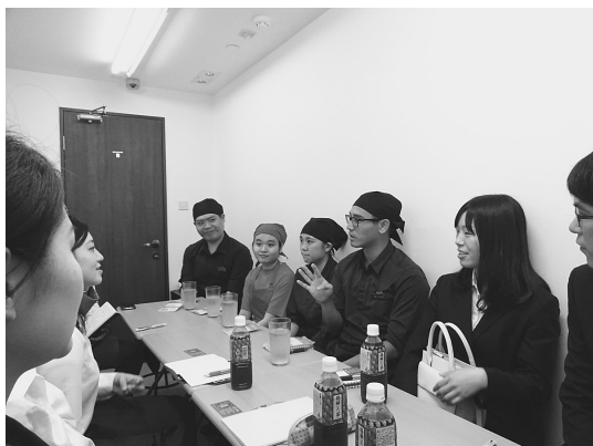
一蘭で香港人スタッフと意見交換

ターフロント海浜公園まで行き、30分ほど、九龍半島から香港島側の夜景を楽しむことができた。これぞ、世界三大夜景の一つとしてつとに有名なヴィクトリアハーバーの「百万ドルの夜景」である。学生達は大喜びであった。